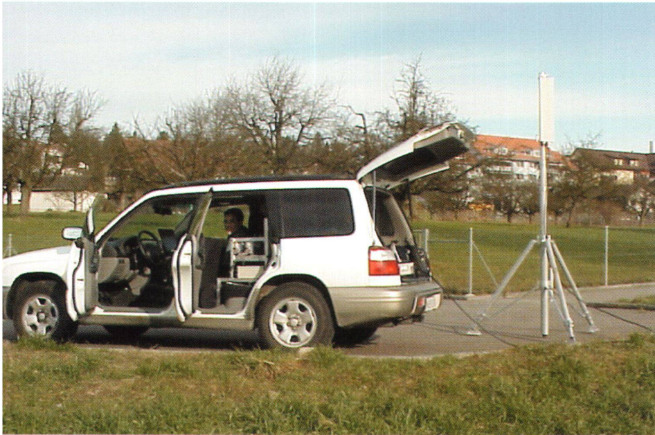
Abb. 8: Messfahrzeug.

Veränderungen eines Namens innerhalb eines bestimmten Zeitraumes. Weiter können Namen zur Beschriftung von Plänen und Karten eingesetzt werden. Swissnames kann auch im Internet optimal eingesetzt werden: als Portal, zur Su-