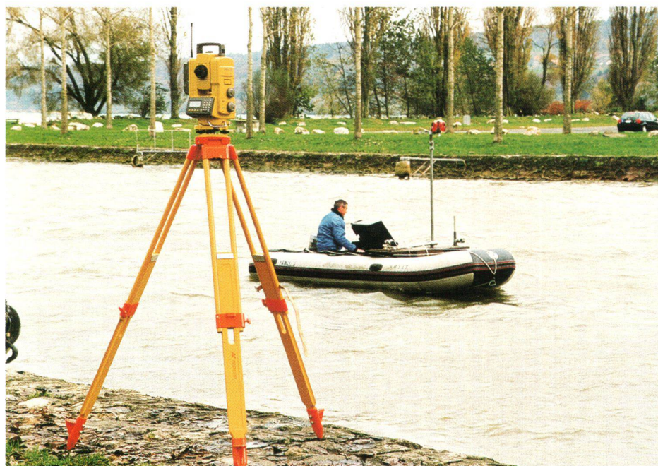
Fig. 3: L'opérateur reçoit en temps réel sa position, ce qui lui permet de naviguer avec précision sur le profil à lever.

Ce procédé ressemble de prêt aux mesures GPS temps réel, mode cinématique. L'avantage d'un instrument automatique par rapport à un système GPS dans le cas précis de ce mandat est évi-