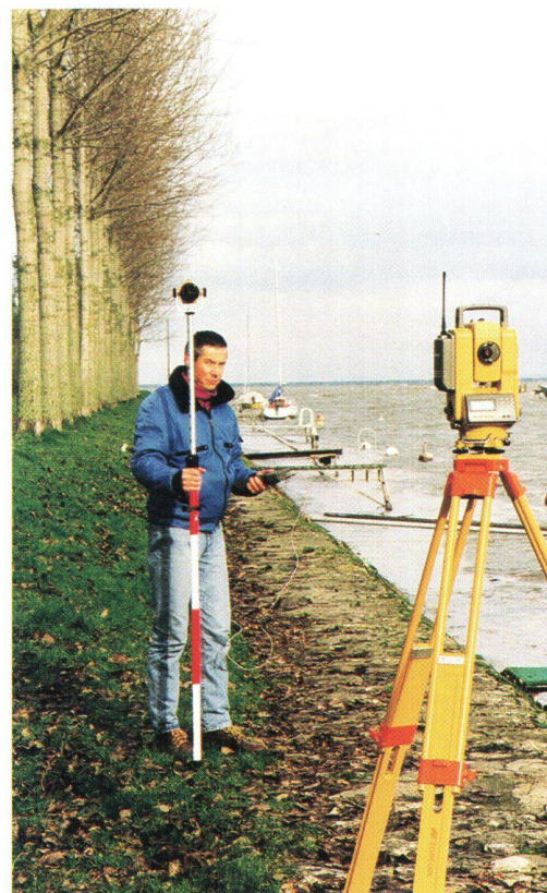
Fig. 1: L'opérateur lève une rive du fleuve, dans sa main gauche le carnet électronique de terrain (Husky). L'instrument assure la poursuite du prisme pour un levé par une seule personne.

La détermination x, y et z des bornes et/ou