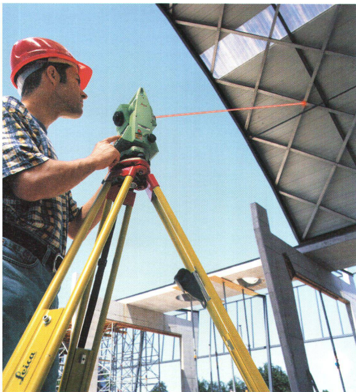
Abb. 2: Reflektorlose Messung mit TCR702. Schnell und bequem. Der sichtbare Laserpunkt ermöglicht exakte Anzielung ohne durch das Fernrohr zu blicken.

Leica Geosystems AG Kanalstrasse 21 CH-8152 Glattbrugg Telefon 01 / 809 33 11 Telefax 01 / 810 79 37 http://www.leica-geosystems.com