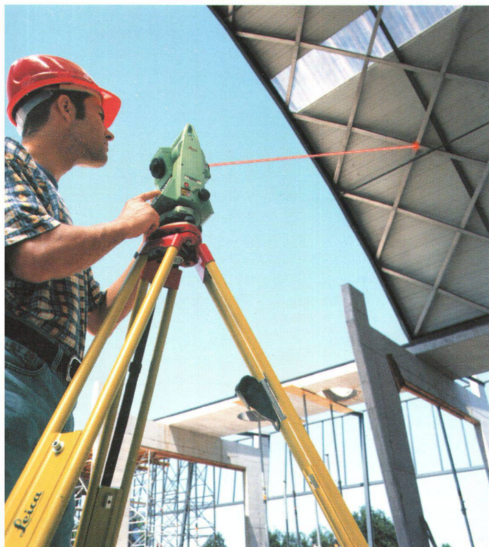
Fig. 2: Mesure sans réflecteur avec le TCR702. Rapide et pratique. Le rayon laser visible permet de visualiser précisément la cible sans que l'utilisateur ait à regarder par une lunette.

Leica Geosystems SA Rue de Lausanne 60 CH-1020 Renens Téléphone 021 / 635 35 53 Téléfax 021 / 634 91 55 http://www.leica-geosystems.com