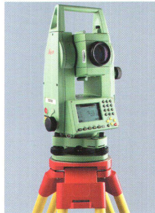
Abb. 1: TPS700 Performance Series. Kompakte, leichte Tachymeter für schnelle, effiziente und komfortable Vermessungsarbeit.

Die TCR-Modelle der TPS700 Performance Series verfügen neben dem konventionellen Infrarot-Distanzmesser auch über einen reflektorlos messenden Distanzmesser mit rotem Laser. Mit dem