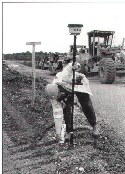
(AGNES = Automatisches GPS-Netz Schweiz)