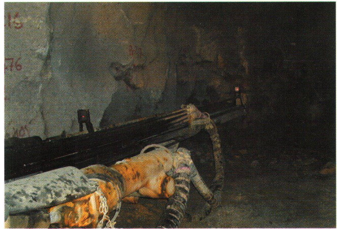
Fig. 5: Fresa con le due tavole di puntaggio.

Il programma ACS-II costituisce il nodo del sistema e a partire da tutti i dati che gli vengono inviati calcola la posizione esatta e la tendenza di avanzamento della fresa, degli anelli montati nonché le correzioni da apportare agli anelli stessi e alla lunghezza dei pistoni. Il tutto viene mostrato su di un monitor sotto forma numerica e grafica, e girando il programma sotto Windows è estremamente amichevole e facile da gestire.