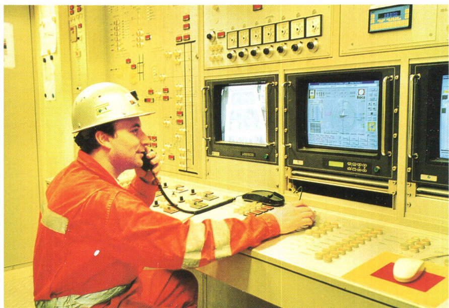
Fig. 3: PC VMT nella cabina di guida.

Dal PC è possibile orientare il teodolite, inoltre si possono determinare le coordinate della mensola successiva su cui lo stesso teodolite verrà, con l'avanzamento della fresa successivamente montato, naturalmente queste misurazioni vengono controllate dal geometra con un altro teodolite, si è però potuto constatare che le differenze sono nulle o minime, contenute in qualche mm.