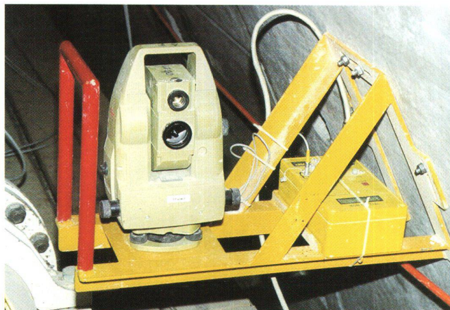
Fig. 1: Stazione VMT con Leica TCA 1100 e Yellow Box.