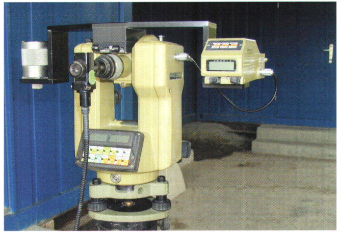
Fig. 2: Sistema di guida ZED-260 con teodolite 71000.

segue automaticamente un bersaglio di posizione nota montato sulla fresa, i dati delle misurazioni vengono continuamente inviati per l'elaborazione ad un Laptop nella cabina di comando.