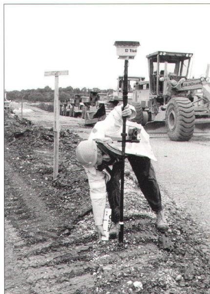
(AGNES = Automatisches GPS-Netz Schweiz)