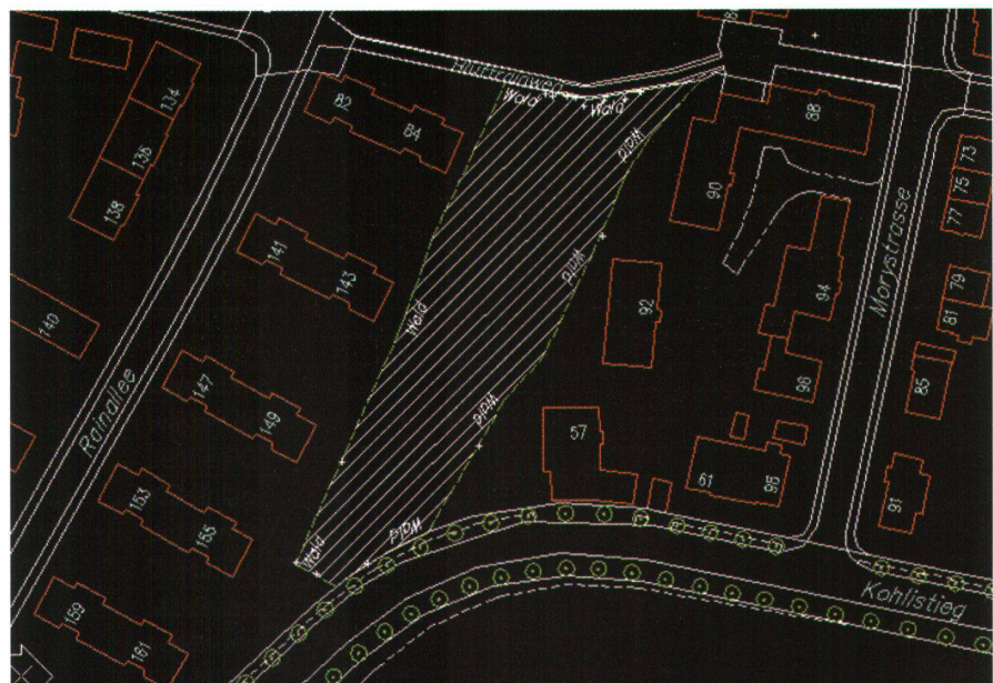
Abb. 2: Grünkataloger.

nen fünf Jahren digitalisiert, und die zugehörigen Daten sind dezentral in den einzelnen Plänen und Zeichnungen gespeichert. Zwangsläufig enthält die dezentrale Datensammlung eine Vielzahl von Redundanzen und ist fehleranfällig, weil Inkonsistenzen zwischen einzelnen Plänen nicht ohne weiteres erkannt werden können. Das KIBa-Projekt hat zum Zweck, diese Daten zu zentralisieren und in eine gemeinsame Datenbank einzubringen, in der sowohl Geometrie- als auch Sachdaten in konsistenter Form redundanzfrei gespeichert werden können. Der zugehörige Geodaten-Server bietet schnellen und sicheren Zugriff auch auf grösste Datenbestände. Das System kann die Daten aber nicht nur verwalten, es ermöglicht auch ihre Bearbeitung und Nachführung, wobei jede Veränderung dokumentiert wird. Darüber hinaus arbeitet es auch als Online-Auskunftsinstrument zum Abruf von beliebigen Informationen über die Abwasserkanalisation. Es entsteht so ein Werkkatalog-GIS, das die Mitarbeiter der öffentlichen Verwaltung bei Planung, Projektierung, Betrieb und Unterhalt dieser wertvollen und für die Stadt existenziell wichtigen Infrastruktur unterstützt. Der Entscheid für Topobase von C-Plan wurde von beiden Amtsstellen unabhän-