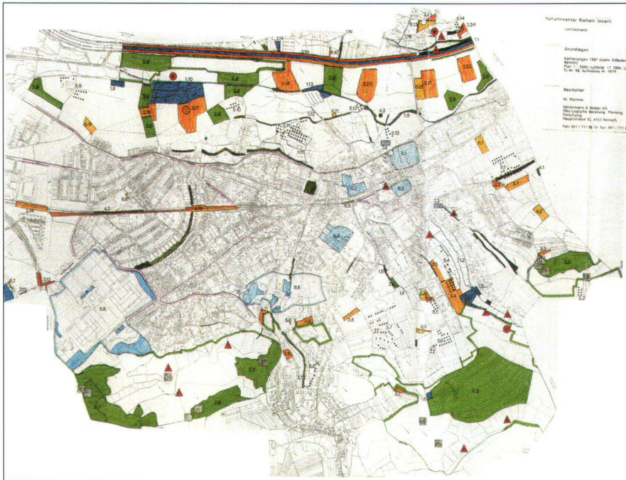
Abb. 1: Riehner Naturschutzinventar.