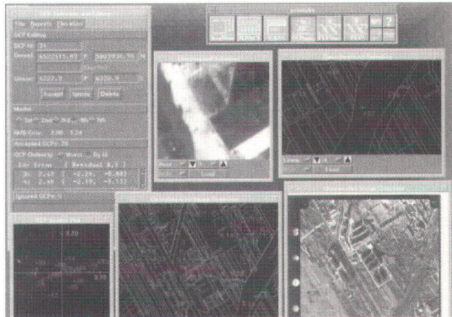
Abb. 3: GIS-Anwendungen.

Dazu kommt noch die Führung der Grundbücher, was Aufgabe der Gerichte ist. Gemeinsam mit dem Gerichtsministerium wurde der Informationsaustausch zwischen den Beständen der Grundstückerfassung und der Grundbücher begonnen, bei Erhalt der jeweiligen Kompetenzen.