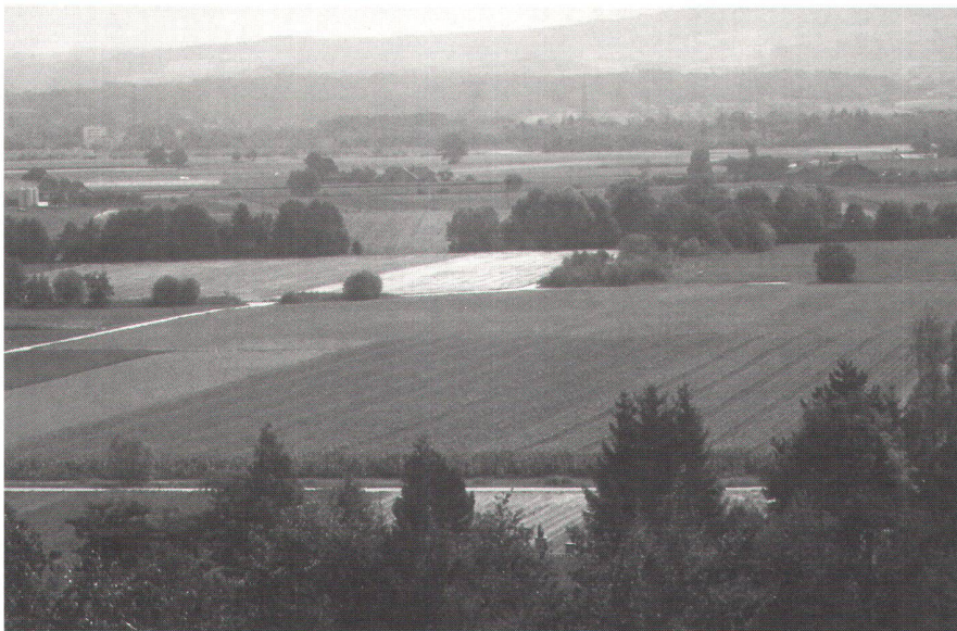
Östliches Seeland, Güterzusammenlegung Jens/Merzligen BE: Rationelle Produktion und ökologische Anforderungen: Zweckmässige Gewanneinteilung und ökologische Vernetzung.

Methode wird bei einigen neuen Projekten getestet.