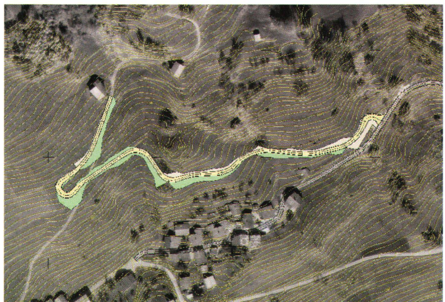
Abb. 5: Orthophoto und DTM mit Strassenbauprojekt der Gemeinde Dardin (Trasse in Gelb, Aufschüttung in Grün, Abtrag in Hellgrau, Äquidistanz der Höhenkurven 2 m).