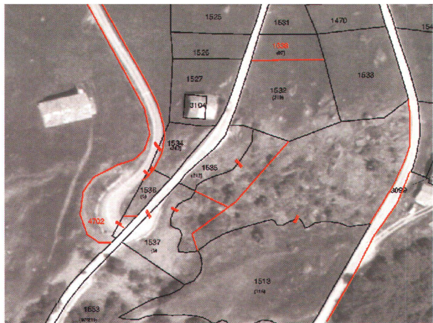
Abb. 3: Orthophoto mit Parzellarvermessung-Grenzbereinigung (Parzellengrenzen gemäss Blitzaktion-Vermessung 1979 in Schwarz, neue bereinigte Grenze in Rot, # aufzuhebende Grenze).