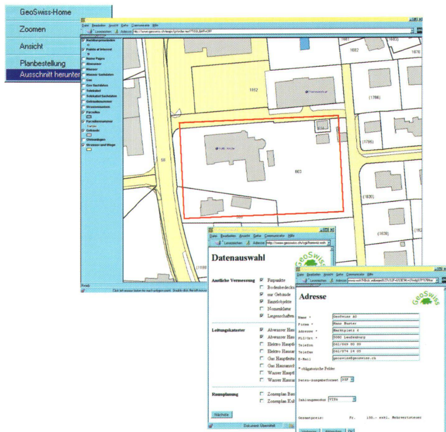
Obige Abbildung zeigt die Beta-Version der interaktiven Datenbestellung.

In einer ersten Version werden Daten mit einem reduzierten Detaillierungs- und Aktualitätsgrad zum Herunterladen zur Verfügung gestellt. Wünscht der Benutzer, wie bisher üblich, Originaldaten der amtlichen Vermessung, kann er das Warenhaus trotzdem benutzen. Anstelle des on-line-Datenbezuges kann er interaktiv seinen Planausschnitt definieren und die Bestellung wird mittels E-Mail bzw. Fax-