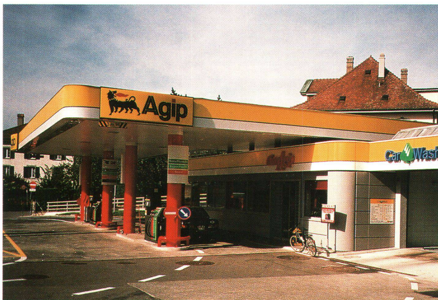
Fig. 3: AGIP gère son réseau de stations-services avec une application Novasys. Abb. 3: AGIP verwaltet und steuert Ihre Tankstellen mit einer Lösung von Novasys.

MapInfo est le leader mondial dans les solutions de Business Mapping et dispose