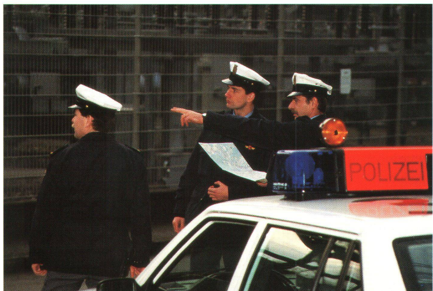
Abb. 1: NovaTrack: Element eines Einsatzleitsystems oder Flottenmanagements.

Wir ermöglichen Ihnen die geographische Verknüpfung Ihrer bestehenden Datenbanken und die Erfassung und Pflege von zusätzlichen Daten über spezielle Eingabemaschinen. Die Daten dieser Einzelplatz- oder Client/Server-Lösungen werden je nach Datenvolumen in Access oder Oracle gehalten.