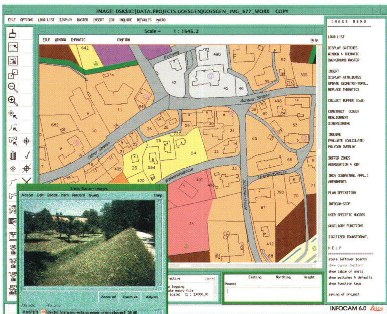
Abb 1: INFOCAM: Leistungsfähige Analysefunktionen erleichtern Ihre Arbeit.

Dieses Softwarepaket bringt Ihnen die Leistungsfähigkeit umfassender Systeme auf Ihren PC. Mit Cadmap/Magellano erfassen und verwalten Sie alle Medien einer Gemeinde effizient. Cadmap/Magellano ist modulförmig aufgebaut und ist somit jederzeit den Gegebenheiten anpassbar. Zur Zeit sind die Module Wasser, Abwasser und Elektrizität erhältlich. Alle anderen Medien wie Gas, TV, Telefon können in graphischer Form verwaltet werden. Der Datenaustausch zu anderen Systemen wird mit verschiedenen Schnittstellen sichergestellt. Der Datenimport und Export kann auch im AVS Format erfolgen. Die Abfrage und Analysesoftware ArcView greift direkt auf die Datenbestände von Cadmap/Magellano und eignet sich somit hervorragend als kostengünstige Abfragestation.