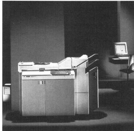
Kopiersystem Océ 3165 für fortschrittliches Kopieren mit digitaler Technik.

Die A. Messerli AG stellt im Bereich digitaler Kopiersysteme ein neues Digital-System vor. Der Océ 3165 beweist, dass fortschrittliches Kopieren mit digitaler Technik keineswegs kompliziert sein muss. Das technisch moderne Kopiersystem macht seinem Benutzer die Anwendung denkbar leicht. Damit werden alle Vorzüge digitalen Kopierens mit der hochentwickelten Bild-Verarbeitungs-Technologie