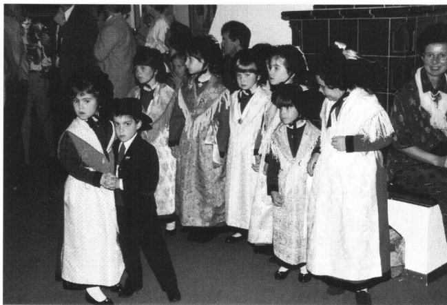
Groupe d'enfants de l'animation.

Wir freuen uns dar- auf, alle im nächsten Jahr in Muttenz wie- derzusehen!