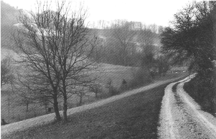
Abb. 2: Naturnahe Landschaftsgestaltung im Rahmen der Gesamtmelioration Asp im Kanton Aargau.