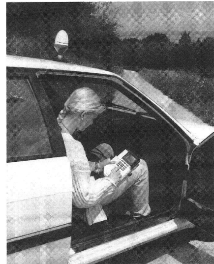
Fig. 2: Magellan NAV 5000 PRO et antenne externe.