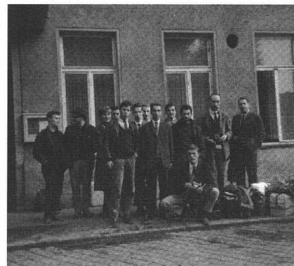
Fig. 1: De la première volée d'étudiants...

Le plan d'études fut modifié à de nombreuses reprises, s'adaptant à l'évolution des techniques et s'ouvrant aux nouveaux champs d'activités professionnelles. Ainsi la mensuration cadastrale numérique, l'informatique notamment graphique, l'environnement lié à l'aménagement du territoire et les méthodes modernes d'acqui-