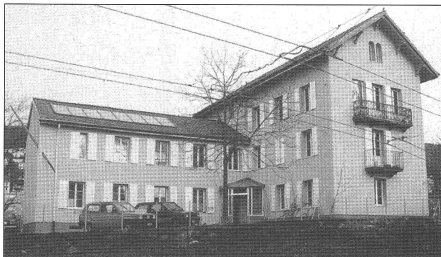
Fig. 3: Immeuble d'habitation à la rue Saint-Nicolas 22: L'assainissement réalisé en 1994 a consisté en: isolation des façades et de la toiture; remplacement des fenêtres par un double vitrage isolant avec couche sélective; préchauffage de l'eau chaude sanitaire par 18 m² de capteurs solaires thermiques; remplacement des calorifères individuels par une chaudière à gaz. L'économie d'énergie thermique est de 6900 m³ de gaz/an, soit une réduction de 55% par rapport à 1993.

d'action – l'information et la sensibilisation du public – en même temps qu'elle met en valeur ce qui a été réalisé. Une occasion aussi pour le Directeur de l'urbanisme, Blaise Duport, de présenter «également le concept Cité de l'énergie prochainement soumis au Conseil général» afin «de nous apporter son soutien dans la démarche qui consiste à populariser l'idée que l'avenir énergétique, c'est l'affaire de chacun». Neuchâtel veut devenir la première «Cité de l'énergie», notamment en abaissant de 13% la consommation d'énergie thermique fossile de son parc immobilier en cinq ans, jusqu'à l'aube du troisième millénaire. La consommation d'électricité du réseau devrait baisser d'environ 7% alors que la part des énergies thermiques renouvelables devrait monter à 6% du