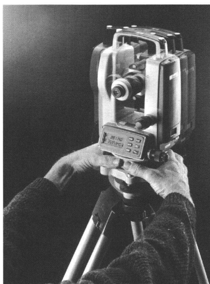
Théodolite électronique de chantier Leica T100.

Aujourd'hui, la détermination de points dans le cadre de travaux de construction typiques comme l'implantation d'angles droits, la mise à l'aplomb et le contrôle d'alignements