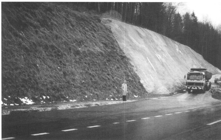
Fig 6: Parement végétal ou gunite?