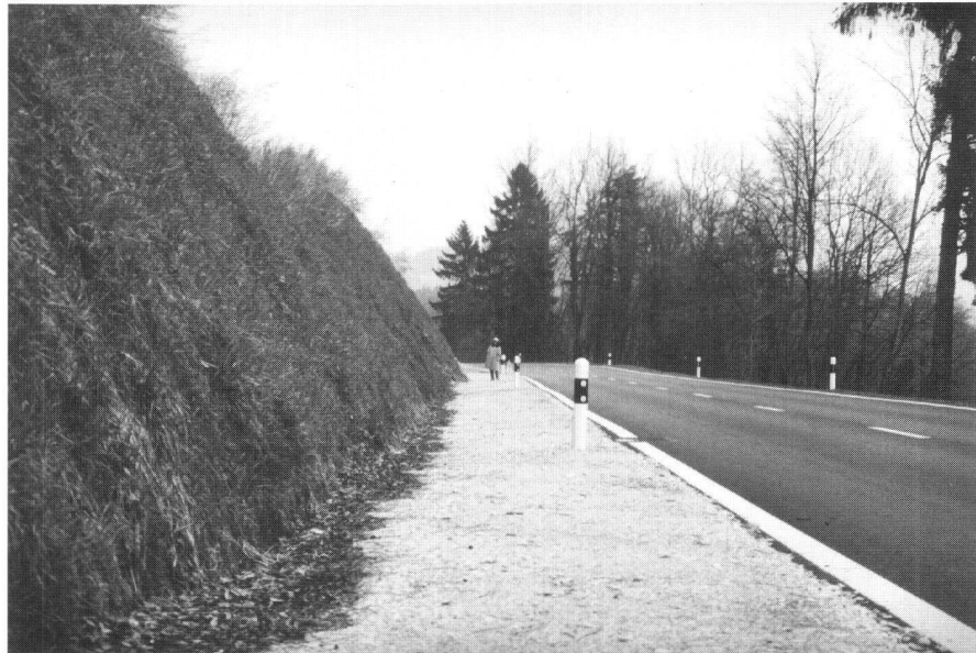
Fig 5: Talus après deux ans.

Ce talus s'entretient comme n'importe quel talus naturel.