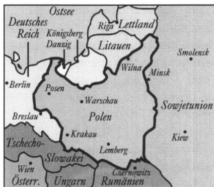
1923 bis 1939