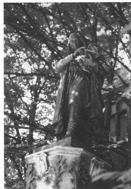
Abb. 3: Kopernikus-Denkmal vor der Jagiellonischen Universität Krakau.