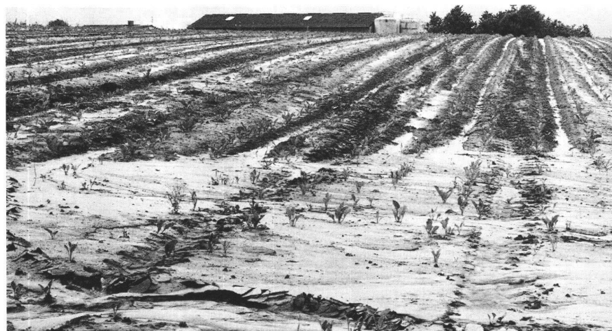
Abb. 2: Die Bodenschäden nehmen zu: Erosion nach Starkregen im Frühsommer. Dégradation du sol en augmentation: érosion causée par de fortes précipitations.