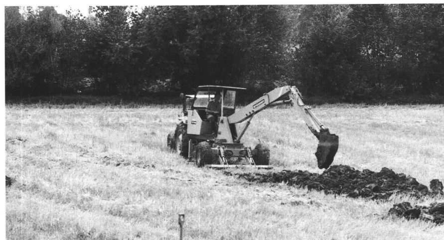
Abb. 3: Siedlungsentwicklung und intensive Landwirtschaft reiben naturnahen Flächen auf. Des milieux proches, de l'état naturel évincés par l'urbanisation et l'agriculture intensive.

(Abb. 1–3 aus Schlussbericht «NFP Boden»: Boden-Kultur, Zürich 1991.)