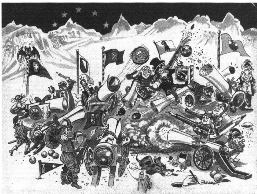
Fig. 1: Entente universitaire helvétique sous un ciel étoilé.

Force majeure du continent, la CE verra ses responsabilités augmenter dans le domaine de la formation. En effet, la révolution économique met les qualifications au centre de la compétition mondiale et l'unité économique que représente la CE doit se défendre. En outre, 1993 implique la liberté de circulation des individus, d'où la nécessité de gérer les ressources humaines dans un marché du travail élargi; et la formation en est l'instrument principal.