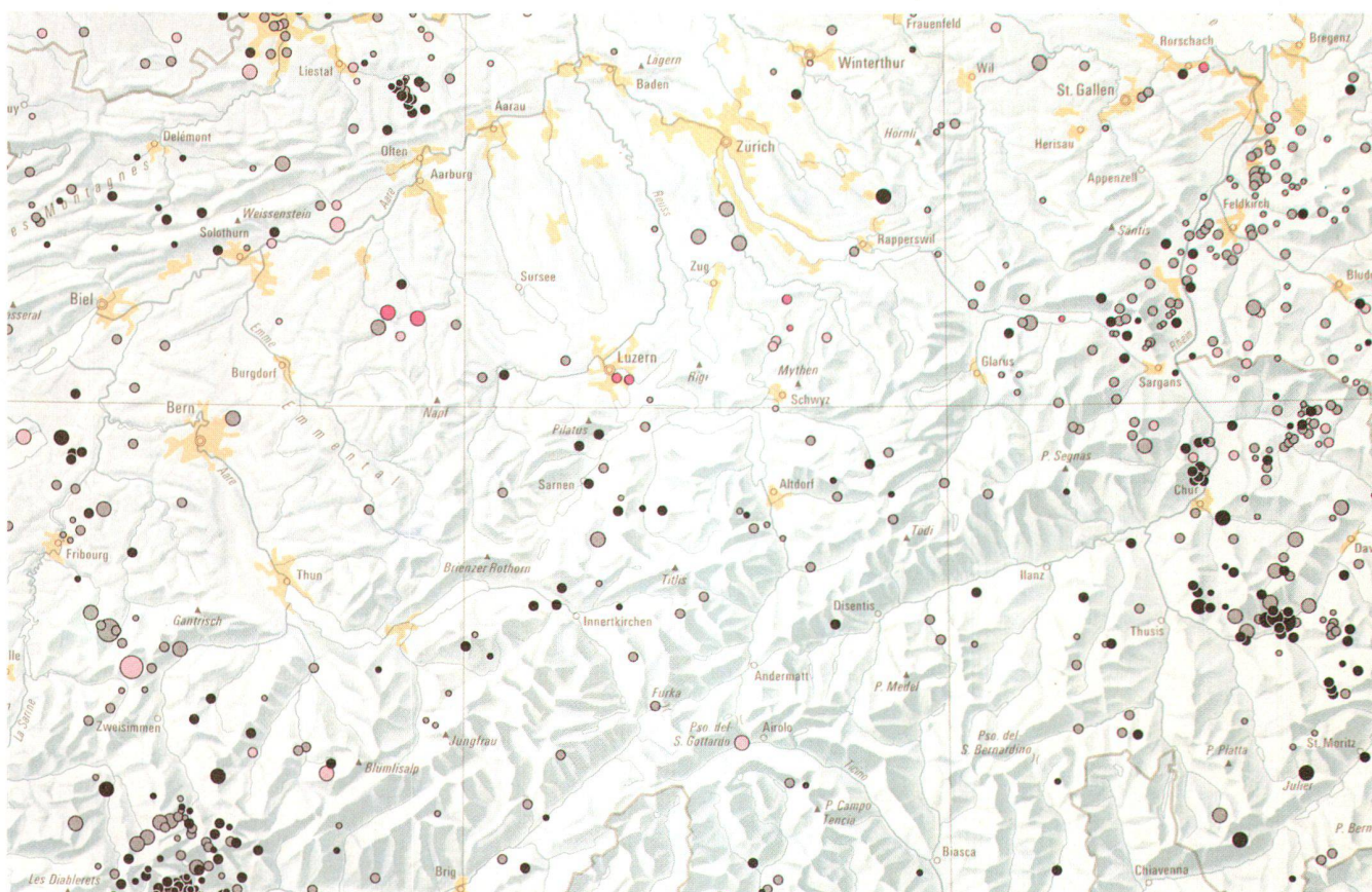
Fig. 2: Atlas de la Suisse, fragment de la feuille 10b, «Gravité, séismicité, géothermie», 2e édition 1984. Rédaction et élaboration cartographique: Institut de cartographie EPFZ. © 1984, Office fédéral de topographie, CH-3084 Wabern.