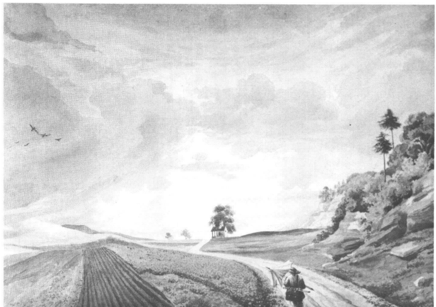
Gottfried Keller: «Landschaft mit Gewitterstimmung» 1842 (Zentralbibliothek Zürich). Der Wanderer im Bild ist ein Selbstporträt von hinten: Man erkennt an seinen Utensilien Kellers «Malerschirm mit dem langen eisenbeschlagenen Stocke und den zwei Riemenlein», den er am 14. Mai 1840 von der Mutter nach München erbeten hatte.

Im November 1842 trat der 23jährige Gottfried Keller enttäuscht und abgewiesen die Rückkehr aus München an, wo er zwei Jahre zuvor zur künstlerischen Weiterbildung als