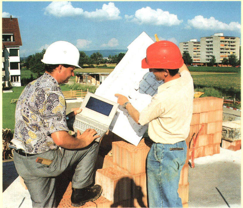
COMPAQ LTE/286 – COMPAQ LTE

Endlich ein Taschencomputer mit hoher Leistung, ohne Einschränkungen. Hier kommt es auf die Anwendungssoftware an. Ob Management der persönlichen Daten oder Management von Projekten – der kleine Vollprofi ist immer dabei.