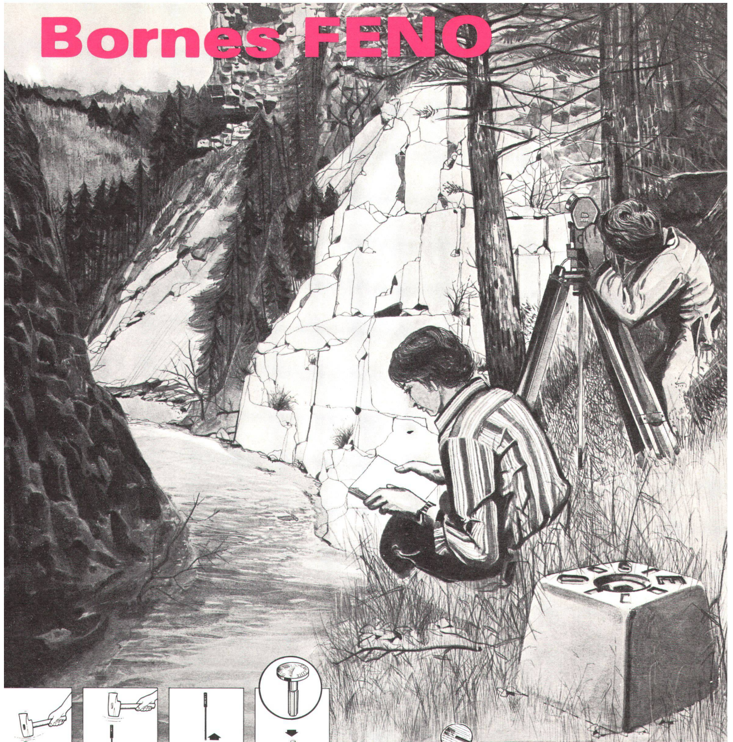
Création Anciaux S.A. Charleville-Mézières