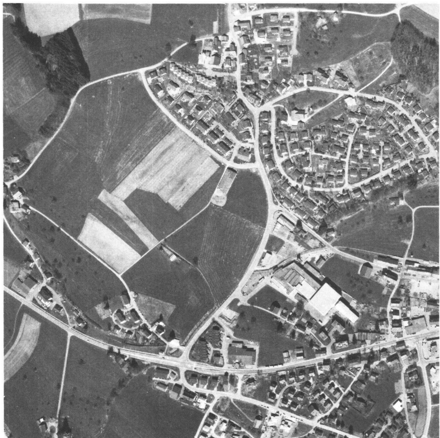
Abb. 1: Blick auf Wolfhausen, Gemeinde Bubikon (ZH). Das gesamte Kulturland zwischen den bestehenden Häusern und dem Wäldchen war als Industriezone eingezont.

Im Mai 1986 hat die Volkswirtschaftsdirektion der Schweizerischen Vereinigung für Industrie und Landwirtschaft (SVIL), Zürich den Auftrag zu einer «Quartierplanstudie Industrie- und Wohnzone Süd, Wolfhausen» erteilt. Im Auftrag wurde festgehalten: