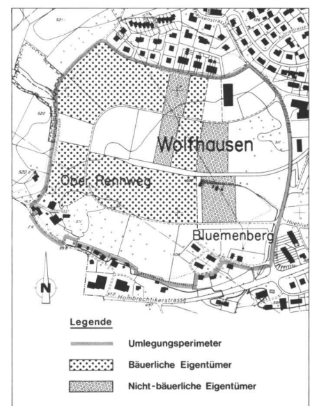
Abb. 3: Beizugsgebiet Entflechtungs-umlegung. Auszonungswillige Eigentümer mit Entschädigungsverzicht.

Für alle diese Grundstücke der beiden genannten Gruppen wurden schriftliche Erklärungen eingeholt. Diese beinhalten das