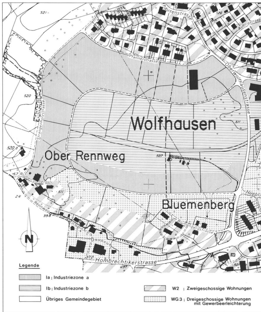
Abb. 2: Alte Zonenordnung. Genehmigter Quartierplan 1979.

Hauptziel der Studie ist es, die Durchführbarkeit einer Revision des rechtsgültigen Quartierplans, den formellen Verfahrensweg und die Lösungsmöglichkeiten skizzenartig aufzuzeigen. Dabei stehen die folgenden Teilziele im Vordergrund: