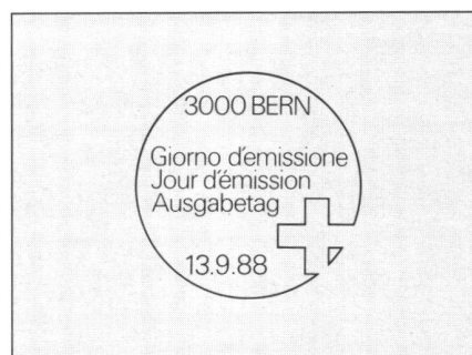
Abb. 4: Der nur am Ausgabetag verwendete Sonderstempel.

Den Umriss der Schweiz hat der Zeichner natürlich gekannt. Ein Vermessungsinstrument hingegen dürfte ihm eher fremd vorgekommen sein. Dass er dabei beim Umsetzen der Foto ins Markenbild ungewollt Reklame für Wild-Heerbrugg geleistet hat, durfte ich ihm offenbaren. Doch wie Sie mittlerweile aus der Presse erfahren haben, hat uns die Zeit schon eingeholt. Es spielt wirklich keine Rolle mehr, wie das Instrument auf der Briefmarke heisst, wenn's nur nicht gerade aus Fernost stammt.