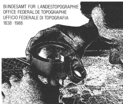
Abb. 3: Ein Kartograph an seiner minuziösen Arbeit. Das Sujet des Ersttagsbriefes.

BUNDESAMT FÜR LANDESTOPOGRAPHIE OFFICE FEDERAL DE TOPOGRAPHIE UFFICIO FEDERALE DI TOPOGRAFIA 1838 - 1988