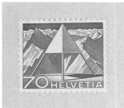
Abb. 1: Der 70-Rappen-Wert von 1949 in violett, mit der Finsteraarhorngruppe im Hintergrund.

Über die Bedeutung des aus dem Griechischen abgeleiteten Begriffes (Philos = der Freund, Ateleia = Gebührenfreiheit) herrscht noch keine absolute Klarheit, obwohl der französische Sammler G. Herpin das Kunstwort bereits 1864 anstelle des zuvor gebräuchlichen Begriffes «Timbromanie» kreierte. Klar hingegen ist, dass die Philatelie ein faszinierendes Hobby beinhaltet. Gute Voraussetzungen für den Aufbau einer Sammlung sind: Systematisches Arbeiten, sorgfältiger Umgang mit den Exponaten und Werkzeugen, Phantasie und Kreativität, also alles Eigenschaften, die in unserem Beruf im Überfuss vorhanden sind. Oder doch nicht? So ist die Philatelie geeignet, uns einen sinnvollen Freizeitspass zu bieten, gar nicht geeignet ist sie als Kapitalanlage, wir sehen: nichts für Krämerseelen.