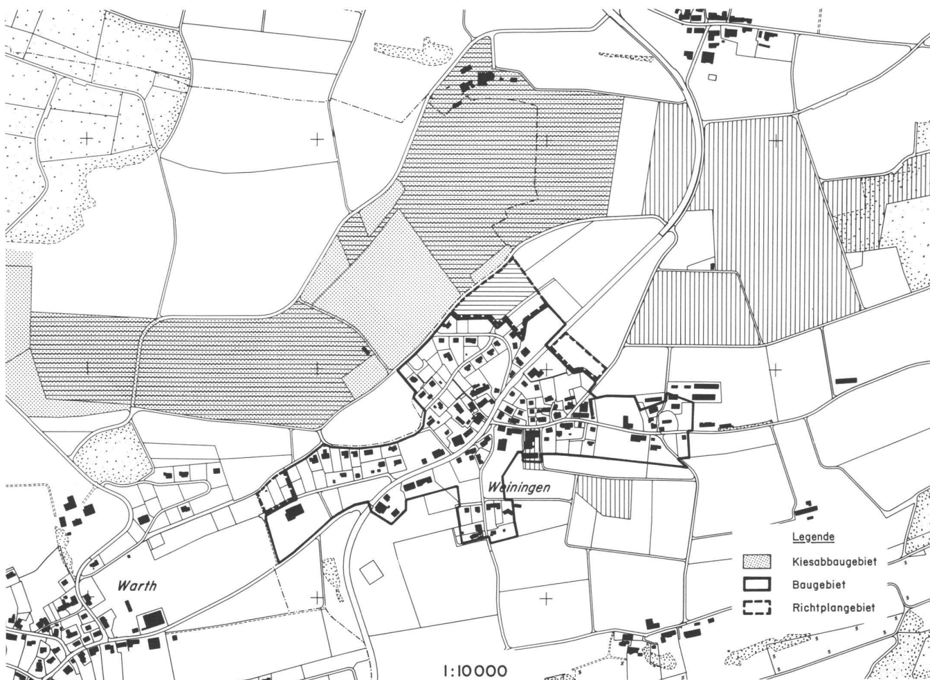
Abb. 3: Ausschnitt Neuer Besitzstand der Gesamtmelioration Warth-Weiningen TG. Landwirtschaftsbetrieb als Beispiel für die Entflechtung zwischen Bauland- und Landwirtschaftsinteressen. Kiesabbaubetrieb als Beispiel für die Entflechtung zwischen Landwirtschafts- und Kiesabbauinteressen.