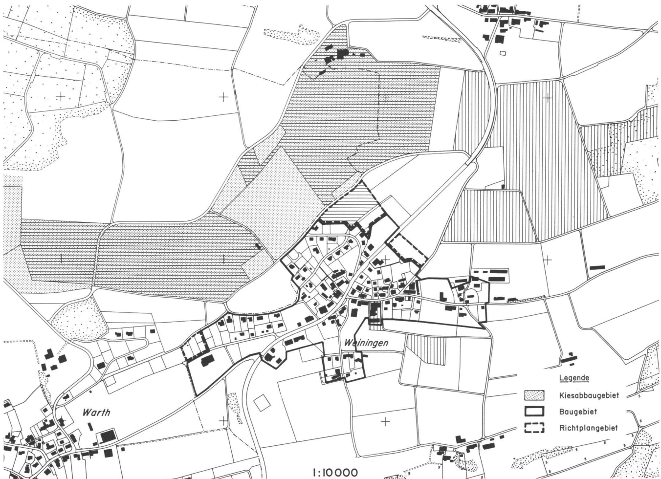
Abb. 3: Ausschnitt Neuer Besitzstand der Gesamtmelioration Warth-Weiningen TG. Landwirtschaftsbetrieb als Beispiel für die Entflechtung zwischen Bauland- und Landwirtschaftsinteressen. Kiesabbaubetrieb als Beispiel für die Entflechtung zwischen Landwirtschafts- und Kiesabbauinteressen.