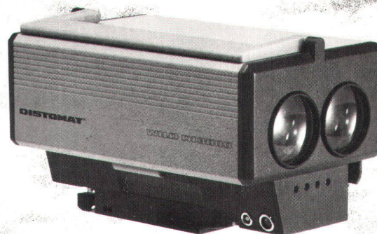
DI3000 DIOR 3002