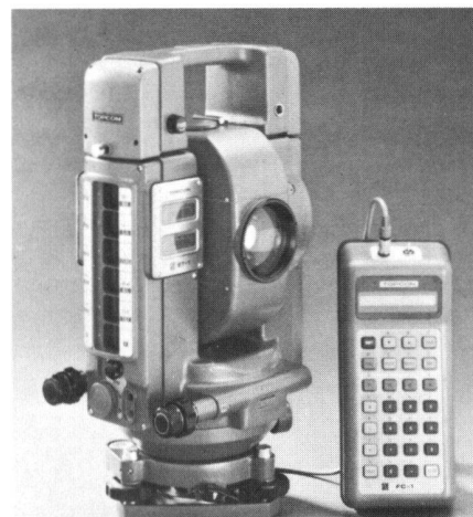
Abb. 1 zeigt die Totalstation ET-1 von Topcon. Sie ist das Flaggschiff einer kompletten Gerätefamilie für die computerunterstützte und millimetergenaue Vermessung. Reichweiten von bis zu 2600 m, elektronische Winkelmessung, berührungsfreie Bedienung, automatische Kompensation der Erdkrümmung und externe Datenspeicher sind nur einige der vielen Vorteile.

Das Vertriebsprogramm wird abgerundet durch Topcon-Universal-Messmikroskope und durch Videobild-Verarbeitungssysteme der Marke Viper von Gesotec.