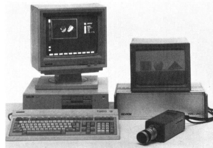
Abb. 2 zeigt das Videobildverarbeitungssystem Viper, welche drei Einsatzschwerpunkte hat: Bildausweitung, Bildbearbeitung und Mustererkennung.

Abb. 1 zeigt die Totalstation ET-1 von Topcon. Sie ist das Flaggschiff einer kompletten Gerätefamilie für die computerunterstützte und millimetergenaue Vermessung. Reichweiten von bis zu 2600 m, elektronische Winkelmessung, berührungsfreie Bedienung, automatische Kompensation der Erdkrümmung und externe Datenspeicher sind nur einige der vielen Vorteile.