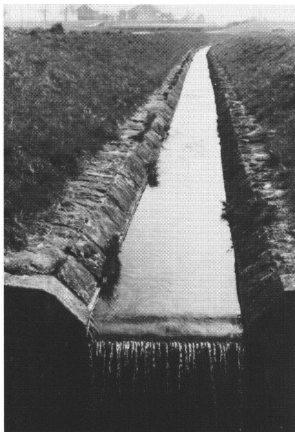
Abb. 1 Der Chrebsbach bei Reutlingen in seiner Verbauung vor 1982.

Priorität der vergrösserten Nahrungsmittelproduktion. Alles irgendwie bebaubare Land musste der Landwirtschaft zugänglich gemacht werden. Damit drängten sich Entschumpfungen, Begradigungen und Eindolungen auf. Es ist darum falsch, einerseits solche Massnahmen aus heutiger Sicht als Fehler hinzustellen und andererseits anzunehmen, die modernen Meliorationen hätten noch die selben Zielsetzungen. Im Gegenteil erkennt man heute, dass gerade die Meliorationen besonders geeignet sind, den naturnahen Wasserbau zu ermöglichen und zu begünstigen, da oft nur durch Landumlegun-