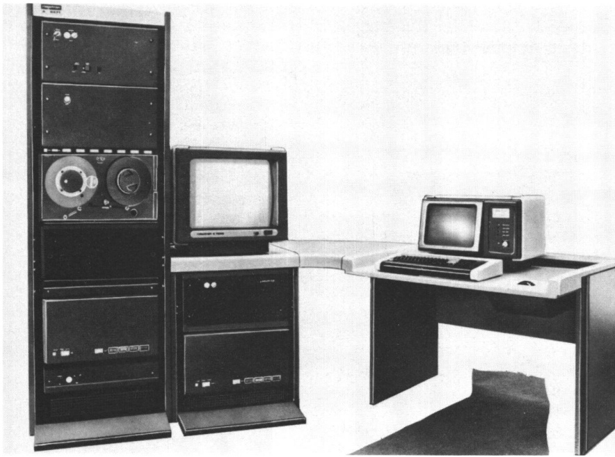
Abb. 3 Bildverarbeitungssystem BVS A6471

photographische Form umgewandelt, mit FEAG o. ä. Geräten. Als Orthophoto besitzt es einen hohen Gebrauchswert. In dieser Technik liegen aber noch weitere Potenzen, die in Zukunft Bedeutung erlangen können. Es ist zu erwarten, dass aus einem digitalisierten Luftbild durch geeignete rechentechnische Filterung und Ergänzung Linien-darstellungen ableitbar sein werden. Das gilt sowohl für die Grundrissdarstellung als auch für Höhenlinien . Für die automatische Herstellung eines Höhenlinienplanes durch digitale Bildverarbeitung ist die Digitalisierung beider Bilder eines Stereobildpaares erforderlich. Im Computer wird durch digitale Korrelation korrespondierender Punkte das digitale Relief berechnet. Daraus lassen sich Höhenlinien ableiten, die z. B. auf einem digital gesteuerten Koordinatographen gezeichnet werden können.