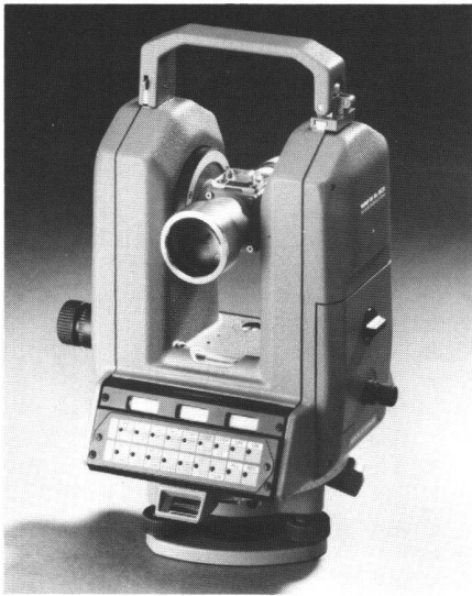
Abb.1 Informatik-Theodolit Theomat Wild T 2000

bekannte elektronische Theodolite, welche im Minimalfall nur so viel «Elektronik» beinhalten, wie gerade für eine digitale Ablesung erforderlich ist. Durch seine einzigartige Winkelmessgenauigkeit und modulare Ausbaumöglichkeiten sowie durch automatische Berücksichtigung von Korrekturwerten, umfassende Datenverarbeitung, automatische Datenübertragung und aufgabenbezogene Programmierung verknüpft der Theomat ausserdem die Funktionen eines klassischen Theodolits mit den Möglichkeiten der Informatik. Mit der Bezeichnung «Informatik-Theodolit» werden die universellen technischen Eigenschaften dieses neuen Konzepts entsprechend charakterisiert und von optischen oder elektronischen Theodoliten und Tachymetern sowie von sogenannten (Total-Stationen) terminologisch ausreichend unterschieden. Der Informatik-Theodolit Theomat beinhaltet alle Möglichkeiten solcher Instrumente, ohne dass ihre Nachteile in Kauf genommen werden müssten, und verfügt in jeder Kombination über programmierbare Intelligenz für die computergerechte Vermessung sowie über ein Höchstmass an Komfort. Er entspricht damit in beeindruckender Weise den Möglichkeiten und Erfordernissen der Zukunft, die auch im Vermessungswesen mehr und mehr von der Informatik geprägt wird.