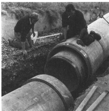
Abb. 2 Das Verbinden der Doppelrohre im Graben. Die Konzentrität der beiden Rohre in der Einbaulage wird durch zwei Auflagerplatten gewährleistet, die an der Kupplung des Innenrohres angebracht sind.

Erwägungen über Sicherheit, Kosten, Haftung und Verlegungsmöglichkeiten führten schliesslich zur Wahl von Asbestzement-Rohren «Eternit», Durchmesser 1000 mm für das Aussenrohr und 800 mm für das Innenrohr. Die konzentrische Anordnung dieser beiden Rohre ergab einen freien Zwischenraum von 2 cm über den ganzen Muffenumfang der Innenleitung. Dieser Zwischenraum gewährleistet den Abfluss allfälliger Wasserverluste in die speziell angeordneten Kontrollschächte. Dort können Zuflüsse jederzeit festgestellt werden.