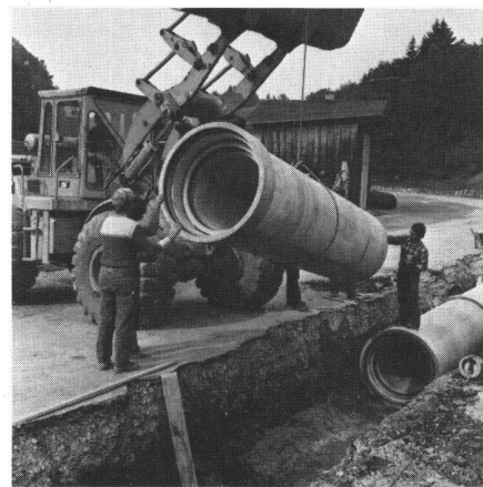
Abb. 1 Das Doppelrohr wird in den Graben gebracht, nachdem unmittelbar zuvor das Innenrohr mit Hilfe des Baggers ins Aussenrohr geschoben wurde.

Die zuständige Behörde verfügte deshalb, dass der Einlauf des Kläranlageabflusses in den Vorfluter erst unterhalb des Pumpwerkes erfolgen dürfte. Diese Bedingung konnte nur erfüllt werden, indem man das gereinigte Ab-