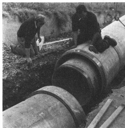
Abb. 2 Das Verbinden der Doppelrohre im Graben. Die Konzentrität der beiden Rohre in der Einbaulage wird durch zwei Auflagerplatten gewährleistet, die an der Kupplung des Innenrohres angebracht sind.

Erwägungen über Sicherheit, Kosten, Haftung und Verlegungsmöglichkeiten führten schliesslich zur Wahl von Asbestzement-Rohren «Eternit», Durchmesser 1000 mm für das Aussenrohr und 800 mm für das Innenrohr. Die konzentrische Anordnung dieser beiden Rohre ergab einen freien Zwischenraum von 2 cm über den ganzen Muffenumfang der Innenleitung. Dieser Zwischenraum gewährleistet den Abfluss allfälliger Wasserverluste in die speziell angeordneten Kontrollschächte. Dort können Zuflüsse jederzeit festgestellt werden.