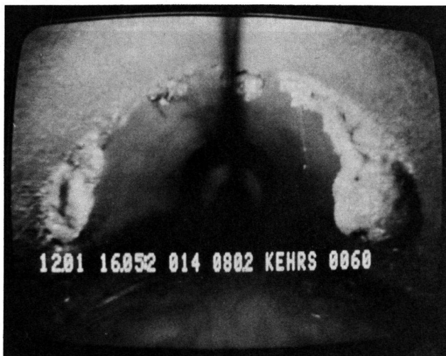
Abb. 1 Ausscheidungen bei undichten Rohrfugen. Die dunklen Schatten stammen von der Kameralhalterung.