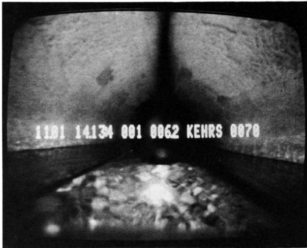
Abb. 2 Kiesablagerung in der Rohrsohle. Die eingeblendeten Ziffern bedeuten von links nach rechts: Datum, Zeit, Aufnahme-nummer, Entfernungsangabe, Ort, Rohrdurchmesser.