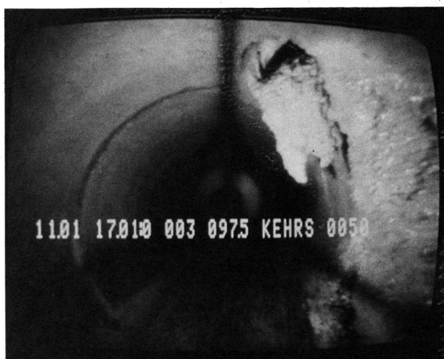
Abb. 4 Kalkausscheidung bei Rohreinmündung.