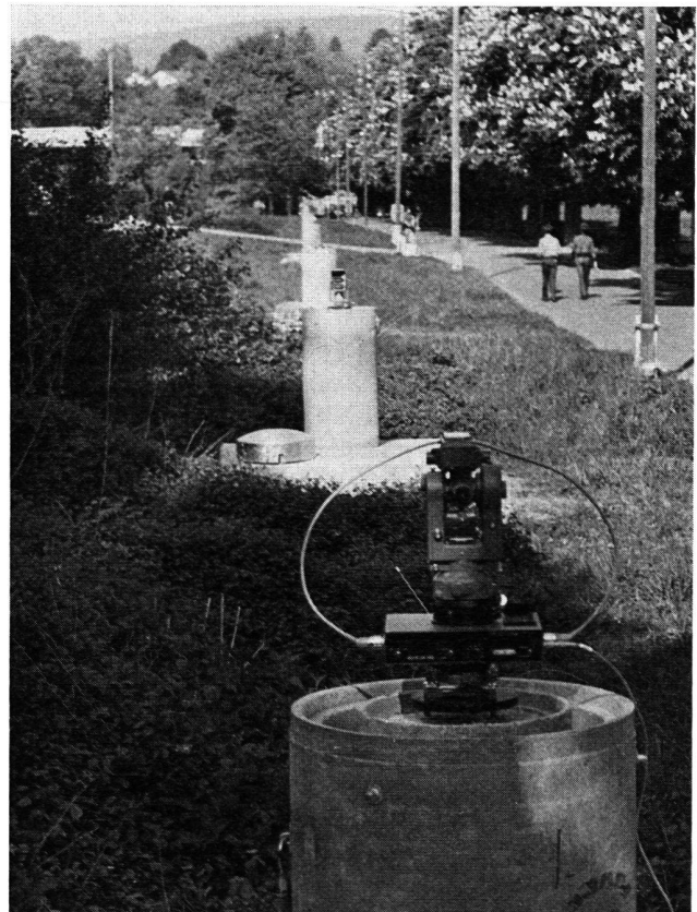
Abb. 1 Blick vom Pfeiler 0 auf die Prüfstrecke: Di 3 S auf der Zentrierplatte mit \frac{5}{8} "-Schraube für diverse Instrumentenadapter.

Nachdem aus den Anfängen mit einem Zeiss-Regelta im Jahr 1972 die elektronische Distanzmessung nun zum Standardverfahren in der Stadtvermessung von Zürich geworden ist, war es an der Zeit, eine Prüfstrecke in der Region zu installieren. Auf dem wohlbekannten Gelände der Allmend Brunau entstand die mit Pfeilern ver-