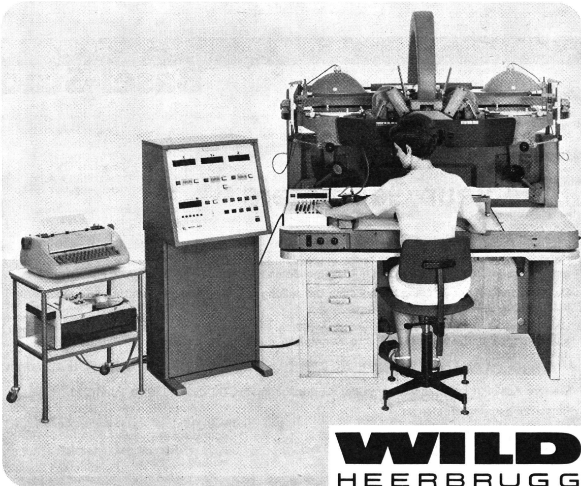
Aviograph Wild B8S mit Koordinaten-Registriergerät EK8