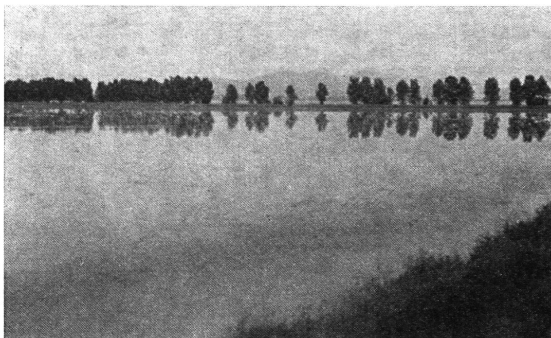
Photo 3: L'exploitation d'Etat de Jelas-Polie aménagée en un grand vivier de 2100 ha

hongrois à l'échelle 1:6250 (25 000 divisé par 4) en Bosnie-Herzégovine, sur 52 000 ha et des plans à l'échelle 1:2880 en Croatie, Slovénie et Voïvodine sur environ 100 000 km 2 ; dans certaines régions très morcelées et dans les villes, on avait dressé des plans à une échelle plus grande. Les