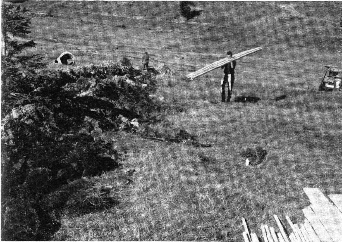
Abb. 4. Einbau von K-Drainrohren beim Alpdraineurkurs 1961 auf Tannenboden/Flums

artige Untersuchungen dürften gegenüber möglichen Einsparungen äußerst gering sein.