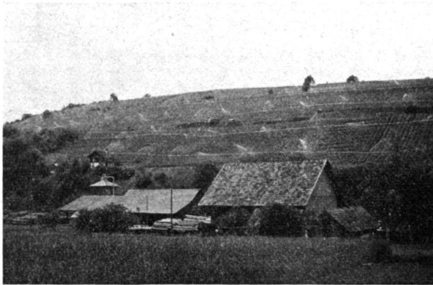
Frostberegnungsanlage «Mühleweg» Schleithelm, August 1956

Wir behelfen uns dadurch, daß wir in der Hauptleitung einen Schieber einbauten, wobei das Wasser für die obere Reblage mittels der beiden Zentrifugalpumpen im Pumpenhaus Oberwiesen mit einer Leistung von 50 m 3 je Stunde bei geschlossenem Schieber in das Leitungsnetz gepumpt wird. Das Wasser für die untere Reblage hat einen freien Zufluß aus dem Dorfnetz und den Druck aus dem Dorfeservoir. Diese Anordnung bedingte die Erstellung von zwei Hauptsträngen in den Rebberg, die mit einem Schieber abgestellt werden können. Wegen der Steilheit und des felsigen Untergrundes wurden Stahlrohre verlegt, und zwar für die obere Lage 125 mm \varnothing ,