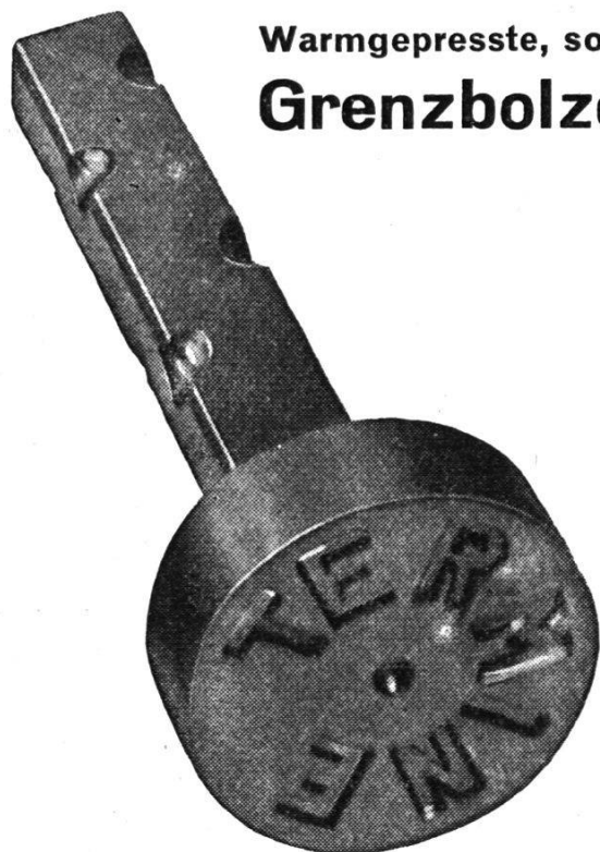
Warmgepresste, solide Grenzbolzen

Lichtpauspapier-Fabrik / Lichtpaus- und Repro-Anstalt / Flascheng. 5 / Tel. (051) 24 47 57