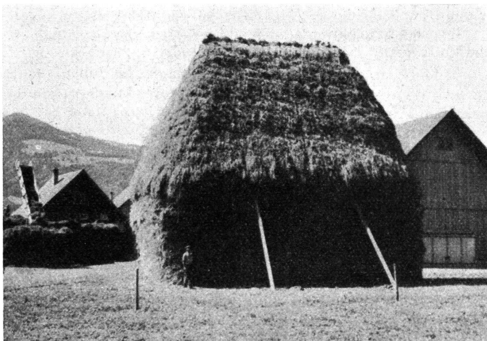
Ernte-Tristen des Jahres 1949

Wir sind davon überzeugt, daß allein schon diese Produktion auf relativ kleinem Raume gelegentliche Ausfälle auf den ‚Bergen und Almen‘ mehr als auszugleichen vermögen, ganz abgesehen davon, daß auch die Berufslandwirtschaft des Gebietes ganz beachtliche Mehrerträge aus dem Meliorationsgebiet erzielt und noch vermehrt erzielen wird, wenn einmal alles Land entwässert und in Kultur genommen sein wird. –