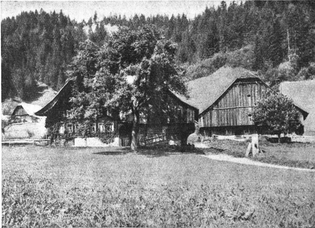
Das typische Entlebuchergehöft (Staldenmoos bei Marbach)

Dreiteilung der Anlage: Haus, Scheuer und Speicher. Das Wohnhaus zeigt bernischen Einfluß: stumpfwinkligen First mit Gerschild. Die Scheuer zeigt in ihrer Verbreiterung nach unten die Anpassung an die Stallgrasfütterung.