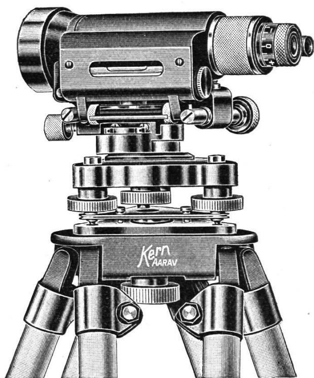
\frac{1}{3} nat. Größe

INHALTSANGABE: Festschrift „Vermessung, Grundbuch und Karte“. — Photogrammetrie und Güterzusammenlegung. Von H. Härry (Schluß). — Über die Erhaltung und Nachführung der Vermessungsfixpunkte. Von J. Ganz, Sektionschef der Eidg. Landestopographie. — Patentierung von Grundbuchgeometern. Géomètre du registre foncier diplômés. — Schweiz. Gesellschaft für Photogrammetrie. Société suisse de Photogrammétrie. — Kleine Mitteilungen.