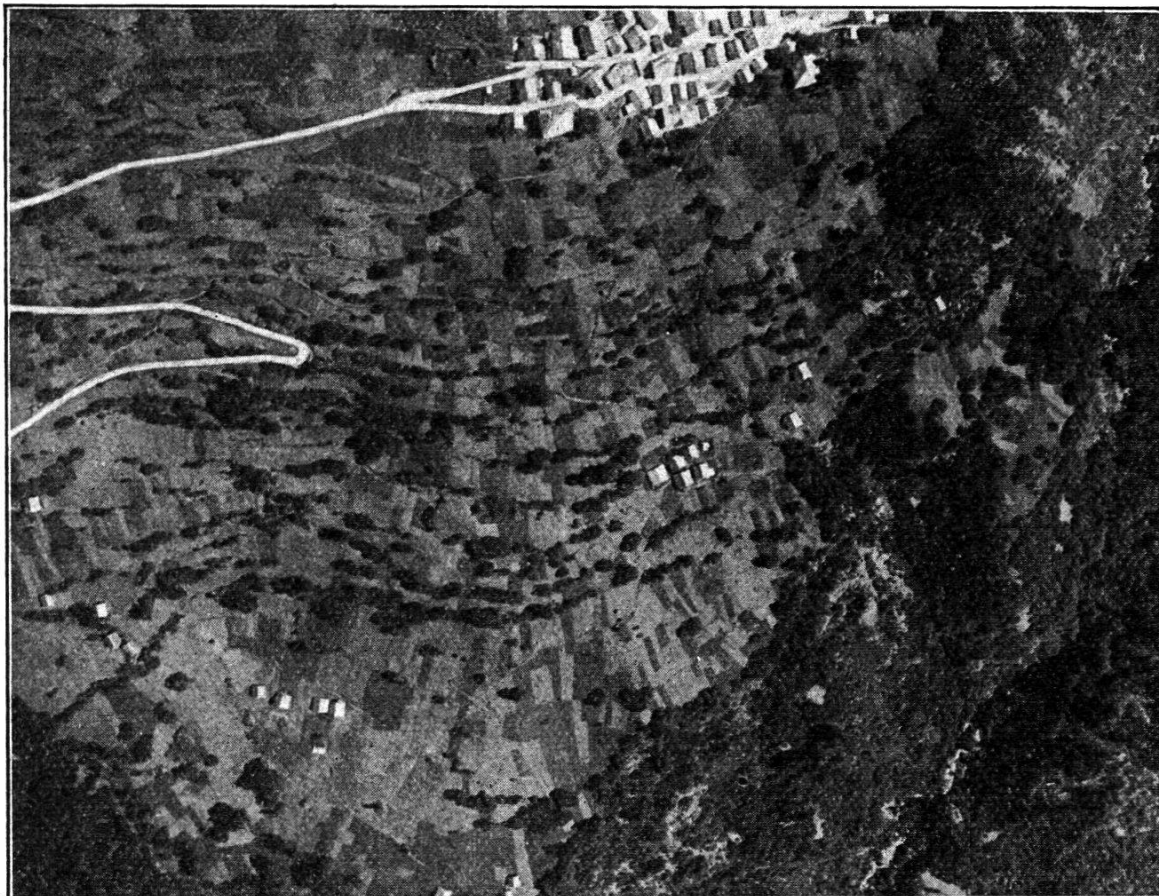
Fig. 3. Güterzusammenlegungsgebiet Campello: Fliegerbild der mittleren Zone