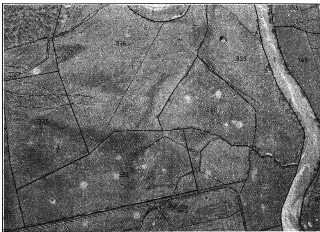
Fig. 2. Ausschnitt aus Original-Katasterplan Sihlseevermessung; einfarbige Reproduktion; Original im Maßstab 1 : 2000 (Entzerrung)