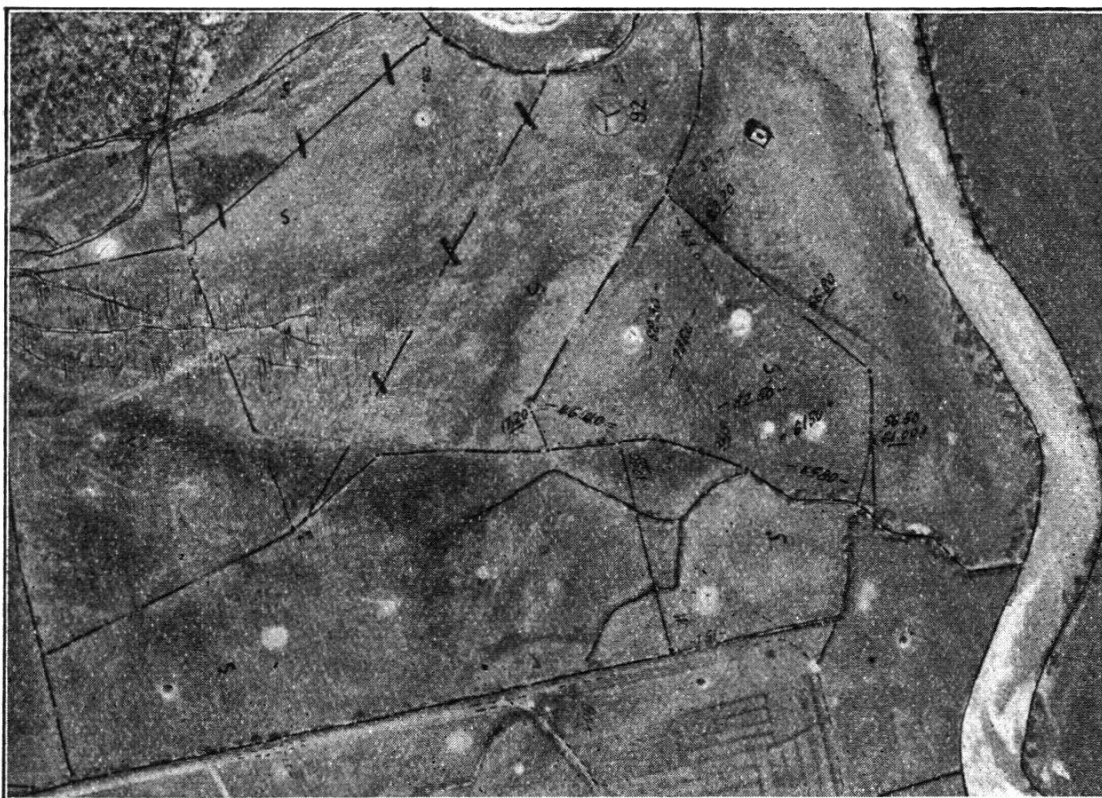
Fig. 1. Ausschnitt aus einem Identifizierungskroki Sihlseevermessung; einfarbige Reproduktion; Original im Maßstab ca. 1 : 2000