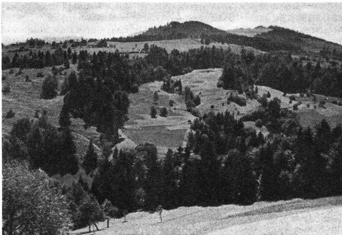
Hochwaldlandschaft (Entlebucher Hochwald E Fischenbach)

Mergelreiche, daher zu Nässe neigende Böden; unscharfe Abgrenzung von Wald und Weide; viel Wiesland, da im Bereich der Wintergüter gelegen. Auf der Anhöhe die alte Siedlung Diebolzrüti.