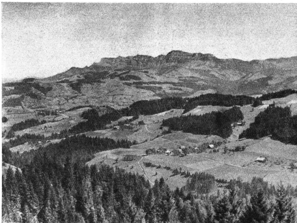
Im Vordergrund die Enneteggterrasse an der Großen Fontannen. Im Mittelgrund die östliche Talflanke des Haupttales um Entlebuch. Blick auf altes Siedlungsgebiet. Nischenlage der kleinen bäuerlichen Weiler. Im Hintergrund die Kalkflühe der Pilatuskette (Wängengrat).

Entlebuch. Hier finden sich die Hauptsiedlungen von sechs Gemeinden, zahlreiche landwirtschaftliche und gewerbliche Kleinweiler, hier auch die Verkehrswege für Auto und Bahn mit ihrem entscheidenden Einfluß auf die Umgestaltung zur heutigen Kulturlandschaft.